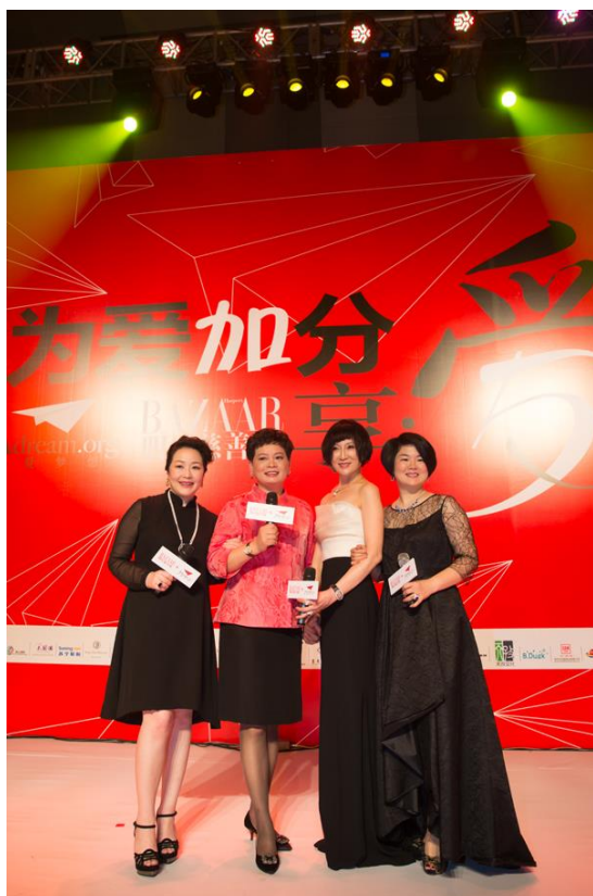
真爱梦想基金发展委员会 主席及副主席 讲述 5 年分享·爱发展历程

由社会各届爱心人士捐赠的各类字画、雕塑、艺术品、珠宝共计 40 余件，当晚筹集善款总额达到人民币 1700 余万元将捐助于真爱梦想公益基金会，用于“梦想中心”素质教育服务体系。其中，深圳木兰汇投资有限公司、广东省工业合作协会、金地（集团）股份有限公司、中国明石投资管理有限公司等企业个人场外共捐赠 521 万元，外加门票、义卖等收入共计 627.31 万元。来自深圳木兰汇投资公司的场外捐赠 300 万元，将与真爱梦想建立一个自信母亲专项基金，期望让每一个受益的母亲也能够从容、尊严地生活。在这里，每一位嘉宾举牌与每一笔场外捐赠都是对于孩子们美好未来的一次投资、一份期许。捐款的增长呈现的是教育改革的价值观的传播，是人们心中的责任和使命的传播。