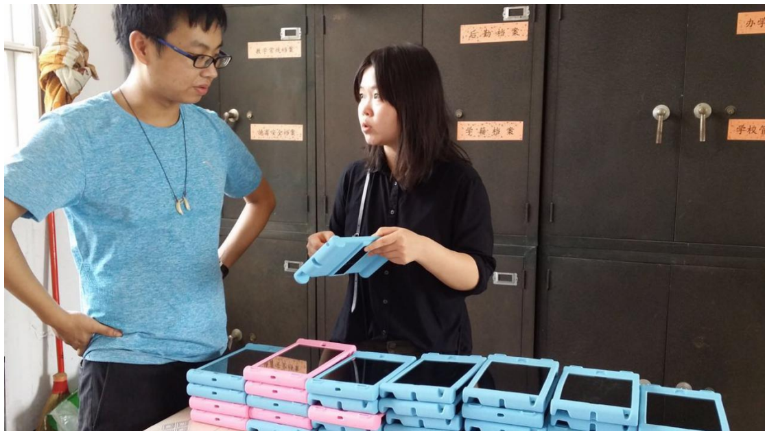
与渔村基础小学老师交接