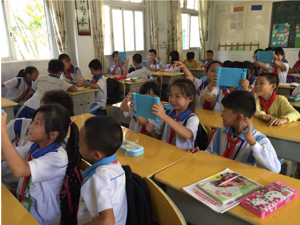
东二小学在上示范课