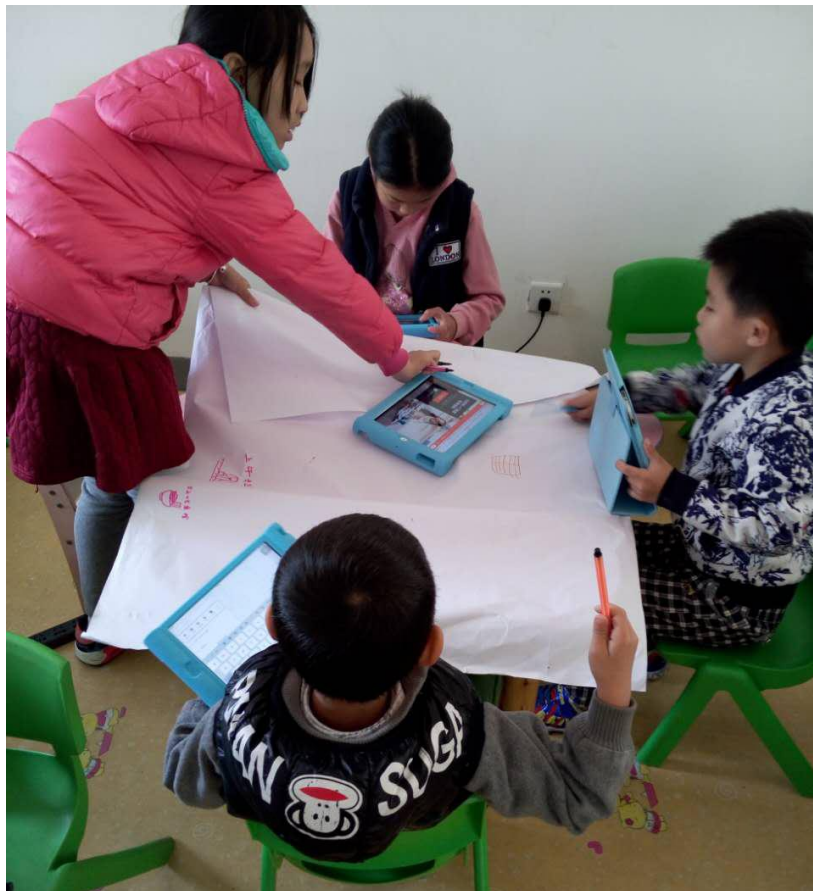
在彭州点亮社区中心，孩子们用 iPad 设计旅游指南