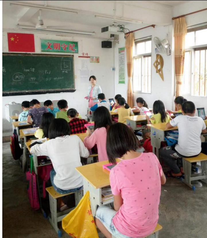
在苏林小学培训六年级