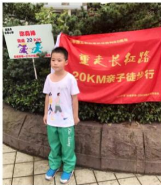
家长给胜利到达终点的小勇士们拍照留念。