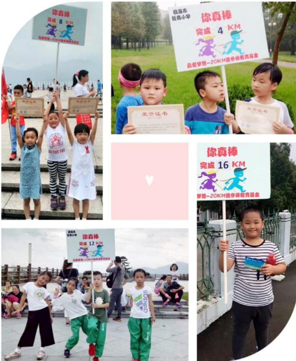
顺利到达阶梯打卡点的小勇士们活力充足！