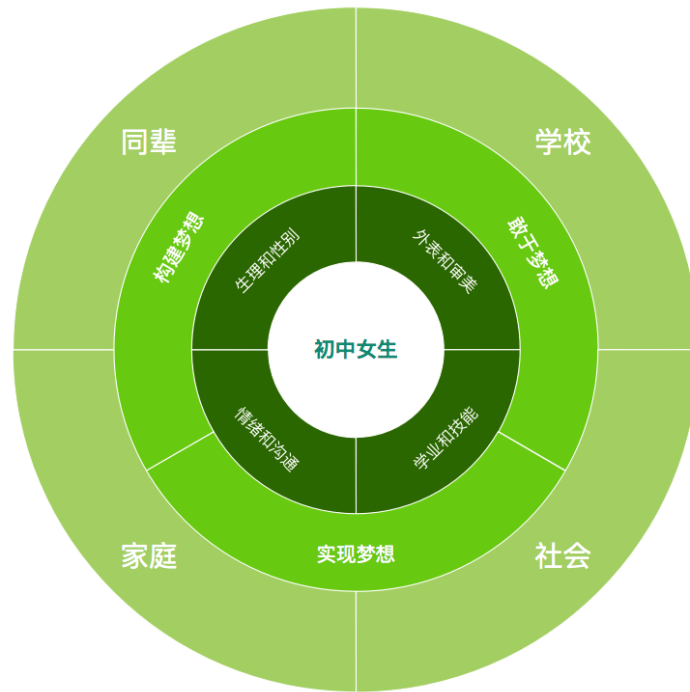
图3：初中女生的需求认知与发展支持闭环

综上，在下一阶段课程设计和支持体系的建立时，应以初中女生自身的需求和权利为中心出发，从多角度帮助建立她们内在的自我认知，为她们的成长培养更强大的梦想力，并形成同辈、家庭、学校和社会的支持闭环。