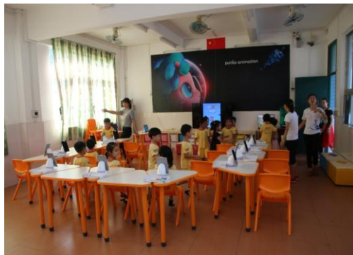
建成后的喜耀粤西学校