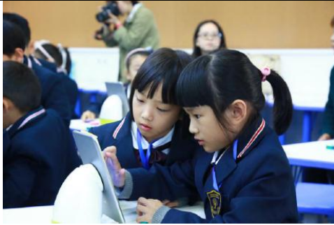
建成后的银湖小学上课场景