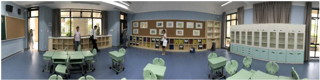
施工前的银湖小学