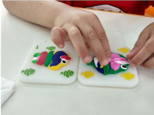
孩子动手制作心中的小鱼