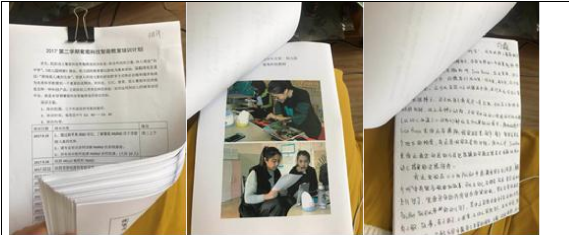
上图为济南槐荫青少年宫第一幼儿园老师进行的课程总结与分享