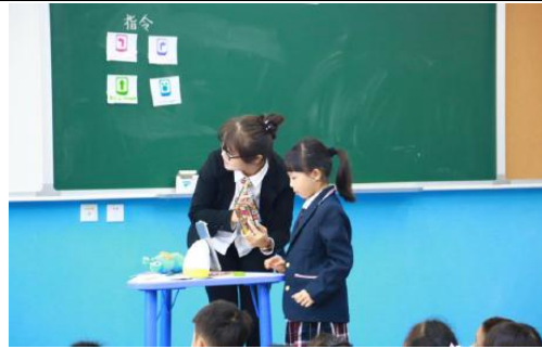
老师在进行编程教育