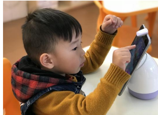
孩子与小鱼进行互动