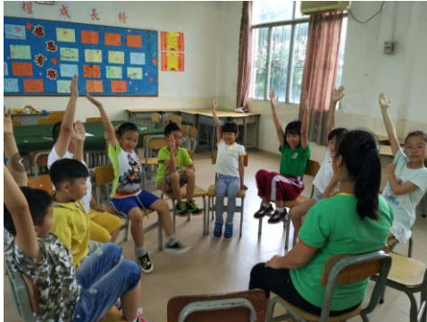
建成前的喜耀粤西教室