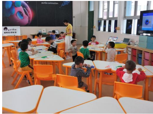
孩子们在教室内上哈尼水族馆课程