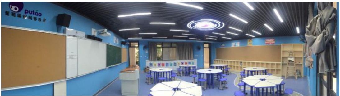
施工后的银湖小学