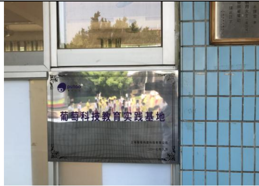
新建成的葡萄教室