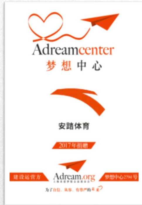
安踏梦想中心捐赠牌