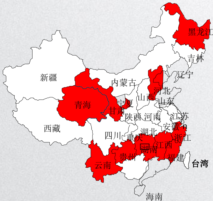
安踏梦想中心所在区域