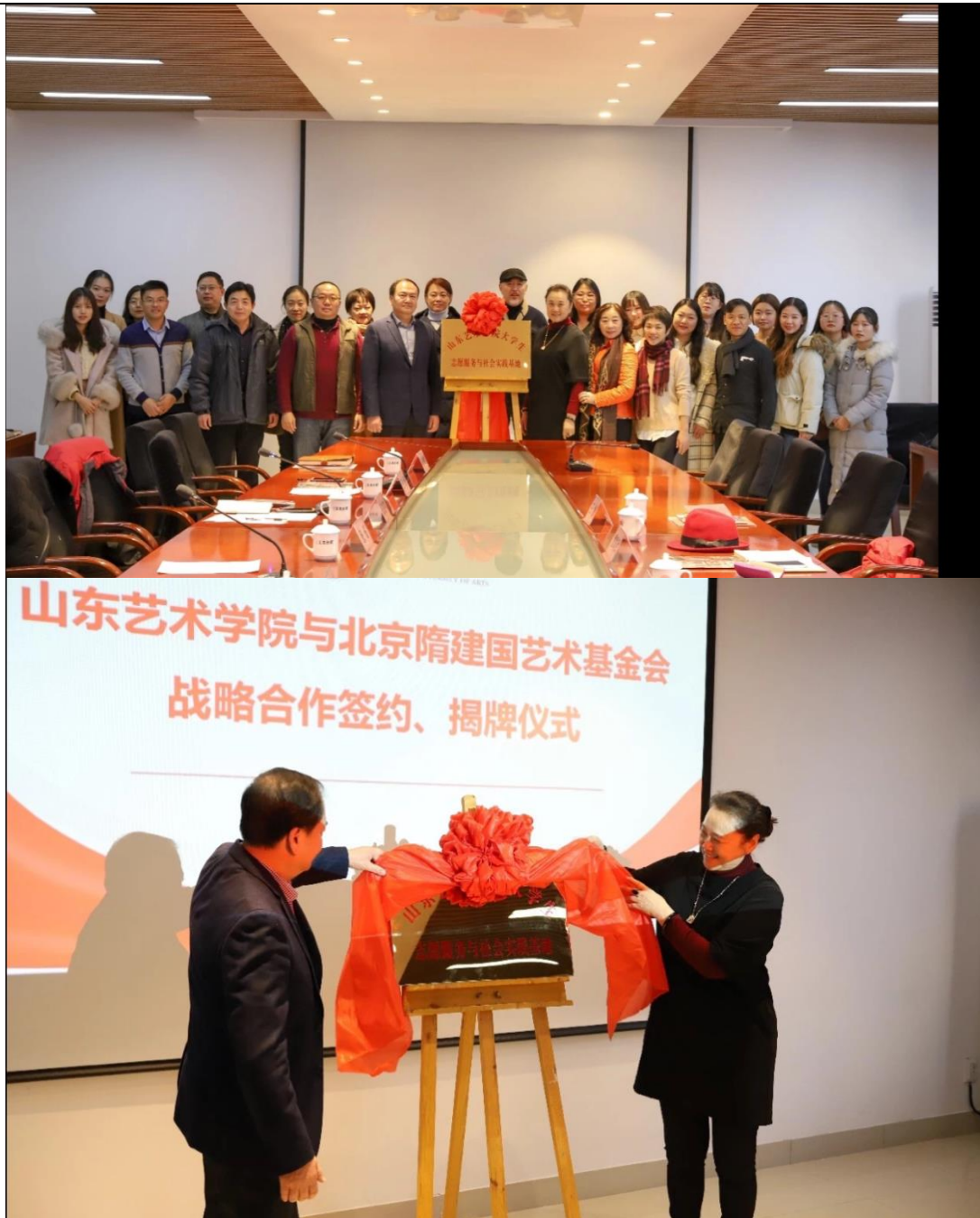
召开志愿者大会并于山东艺术学院合作设立志愿者实践基地