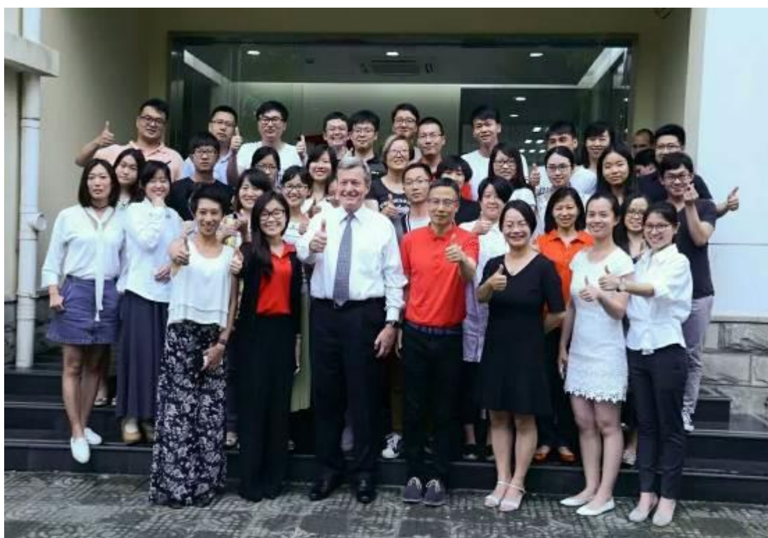
美国大使和真爱梦想的员工合影