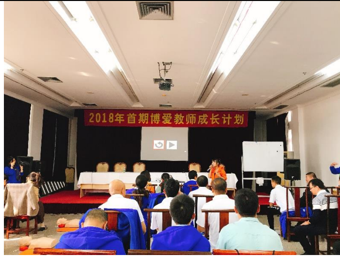
（博爱教师成长计划—儿童安全第一课宣讲师培训）