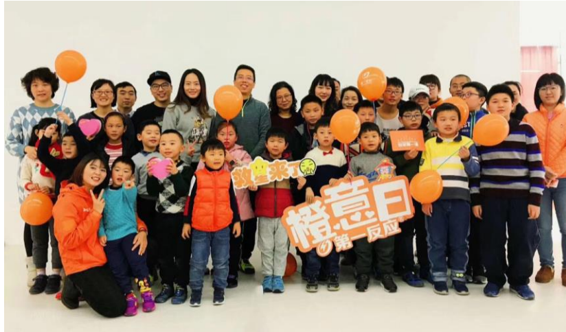
（橙意日线下亲子急救小课堂活动，让家长 and 小朋友一起学习急救知识，带动整个家庭的急救意识，安全一家人。）