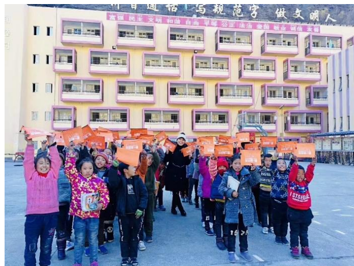
（小朋友们通过愉快的游戏学习急救知识）