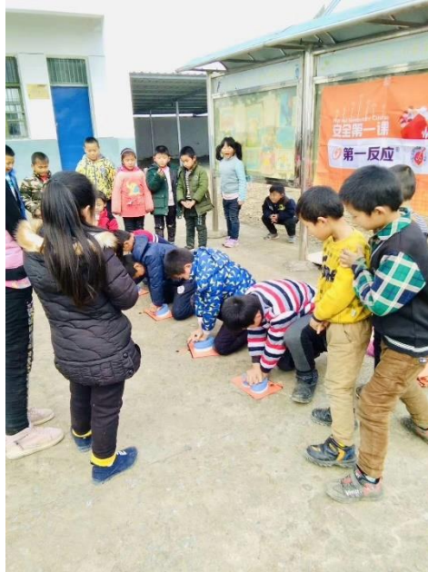
(使用专利小教具体验心肺复苏的按压)