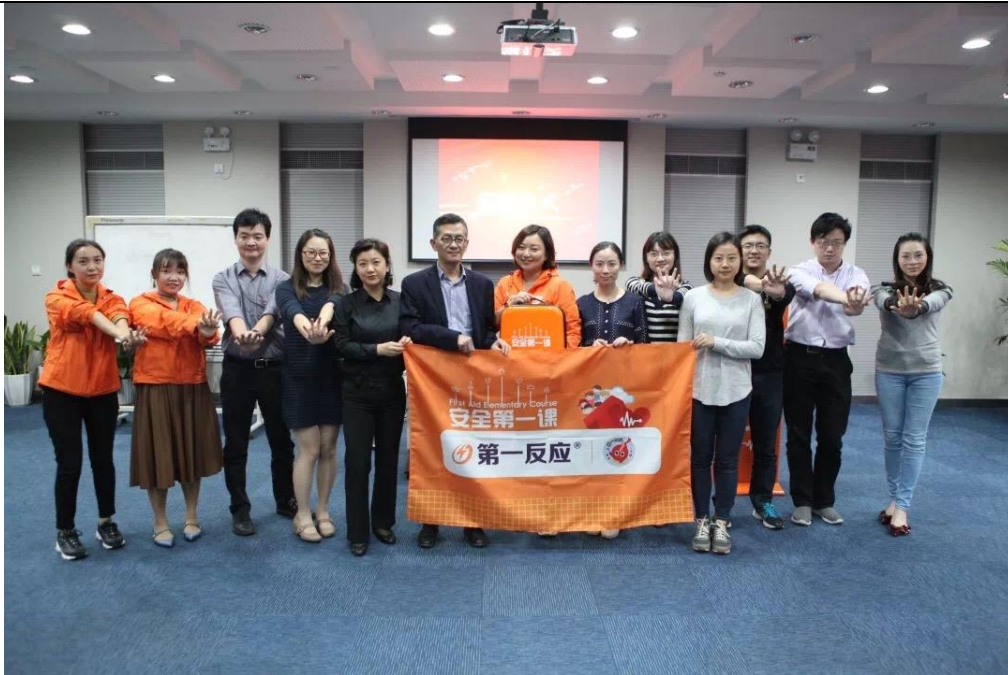
(文广互动媒体志愿者宣讲师培训)

季度财务支出明细 (请将季度财务支出明细表至于位置, 预决算对比误差超过10%的项目, 请备注说明差异原因。)