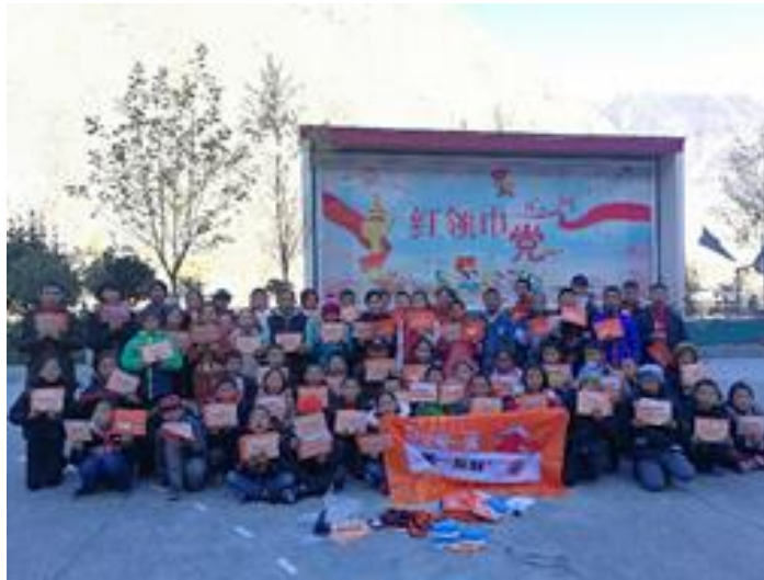
（儿童安全第一课的宣讲师与孩子们的大合影）

在参加第一反应儿童安全第一课青少年宣讲师培训的老师中，有两位老师是来自偏远山区木苏乡中心校的老师，课堂中我们两位老师是那样的认真仔细，两位老师想从大城市带着满满的安全知识回到校园中，将课程带回了木苏乡中心校孩子们的课堂，让大山里的孩子有了人生中第一堂急救课，使每一个孩子都能够掌握在保证自己安全的情况有效、正确掌握急救基本知识，本堂课在既轻松又愉快的教学氛围中结束。据前方两位老师发来的报道表示：孩子们的学习兴趣是那样的浓郁，恨不得都能亲身体验在课堂实践中来。我们真的希望我们的儿童安全第一课能够普及更多的孩子，也特别希望安全第一课走进偏远山区孩子们的课堂，让他们在医疗条件不佳，父母不在身边时，也能很好保护自己，让自己快乐成长！