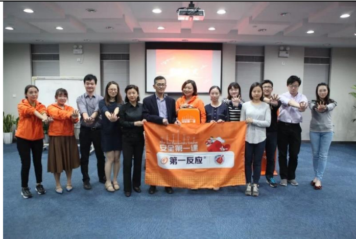
走进社区工作团队，培训 10 人