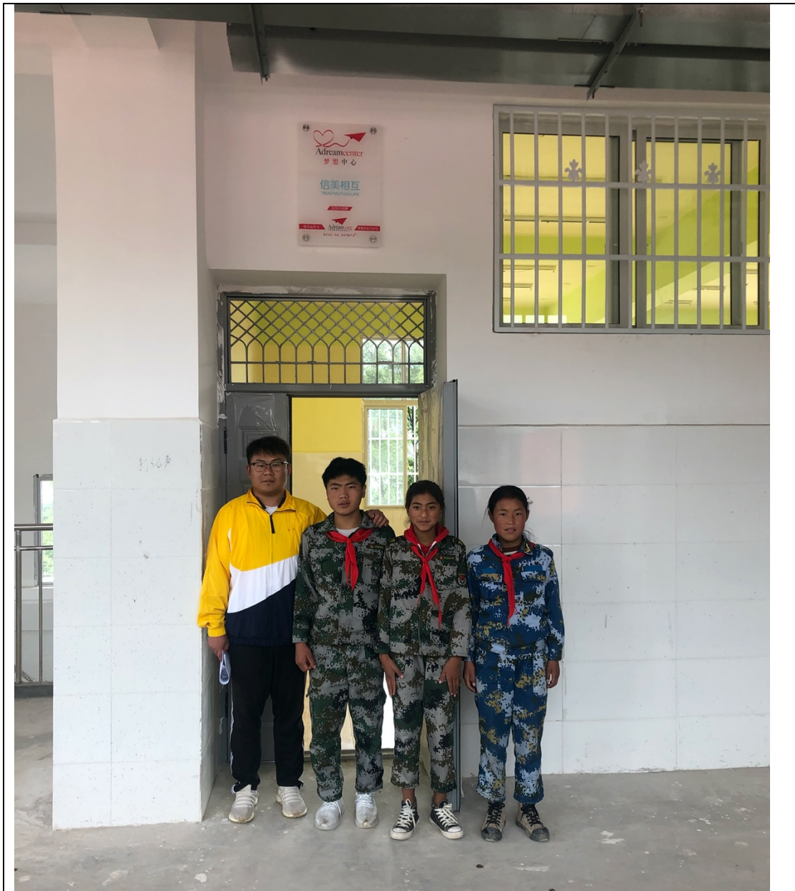
（信美相互梦想中心正式挂牌）