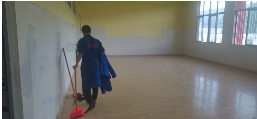
(梦想中心 5 月实景)