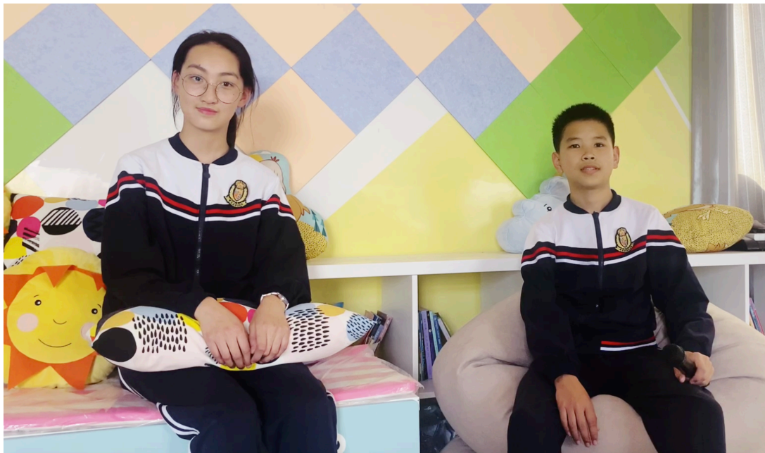
（富顺县永胜九年制学校）

这是在特殊时期度过的有意义的节日，孩子们也获得了信美赠送的节日礼物，爱意满满的公益抱枕，牵挂着大山那一边的孩子们。