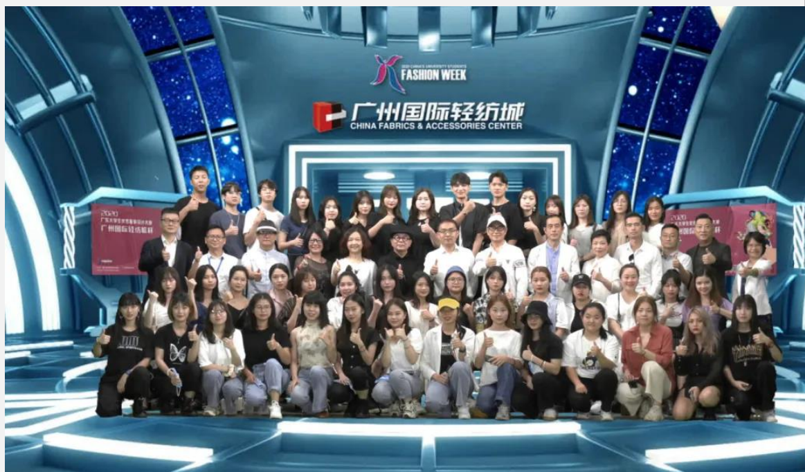
参赛设计师与嘉宾领导大合照