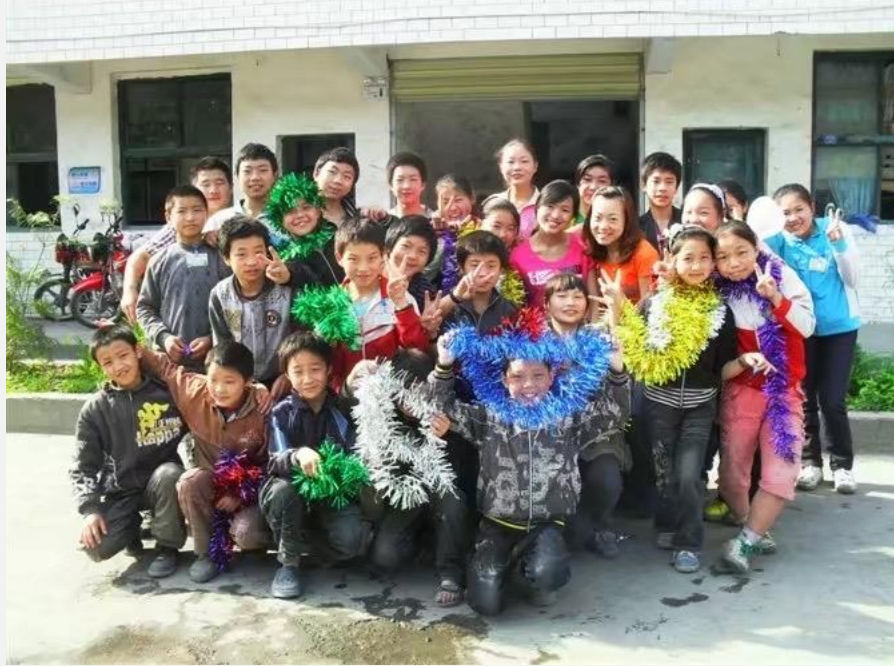
▲现在的谭校长在永和小学任教，陪着又一群可爱的孩子们长大

印象最深刻的是，当问孩子们最喜欢《点亮梦想》这个绘本的哪一页？有的孩子说最喜欢星空，有的孩子说，希望自己是从小鸟笼飞出去的鸟。