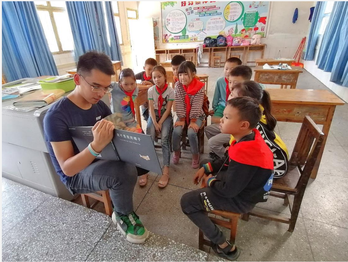
▲担当者行动的工作人员给石柱的孩子们讲绘本