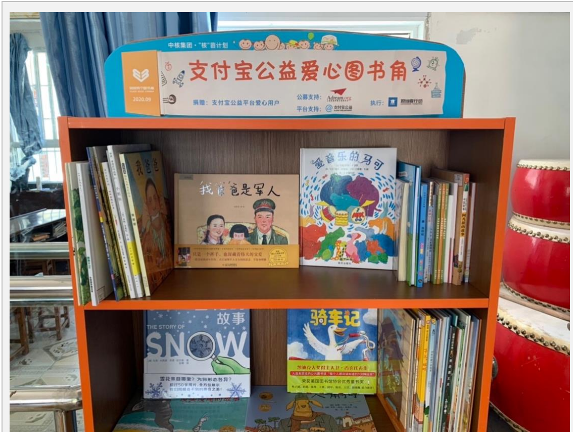
▲在石柱建设的支付宝公益爱心图书角