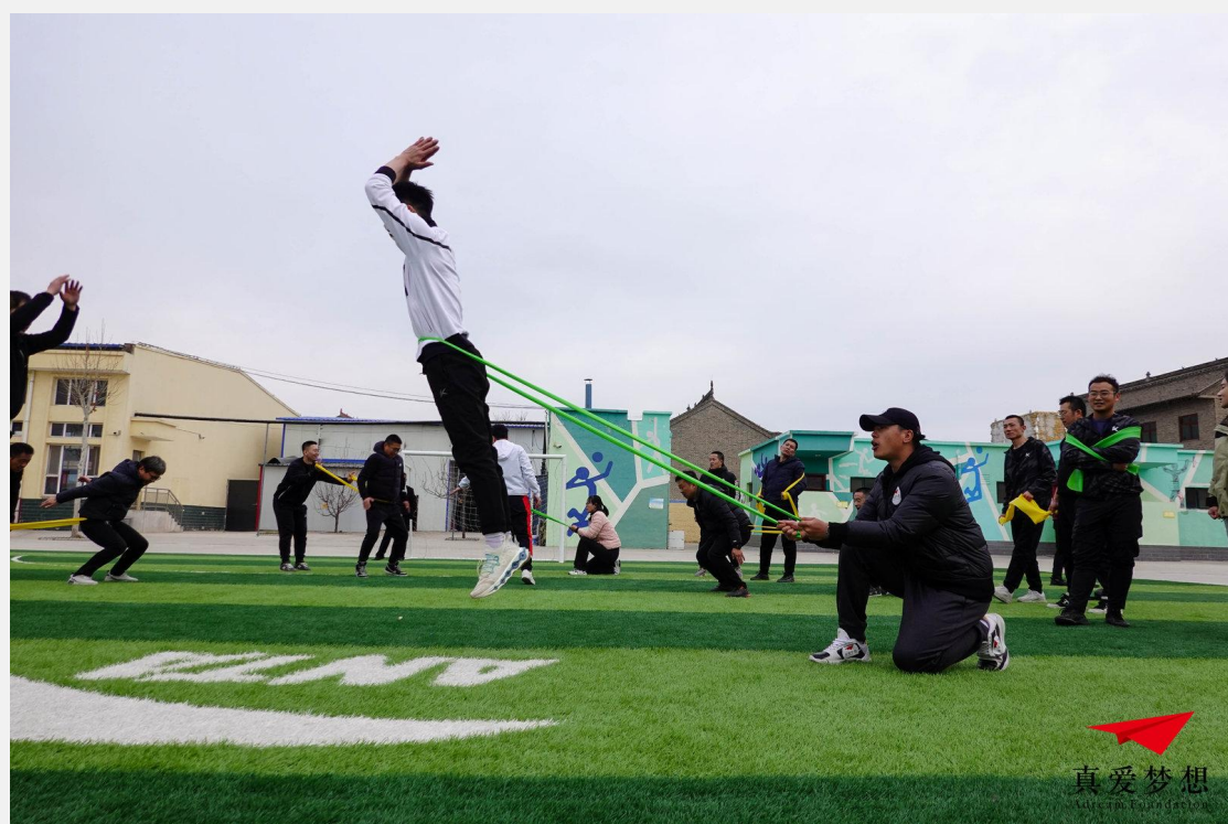
安踏体育课一星体育教师培训-临猗站