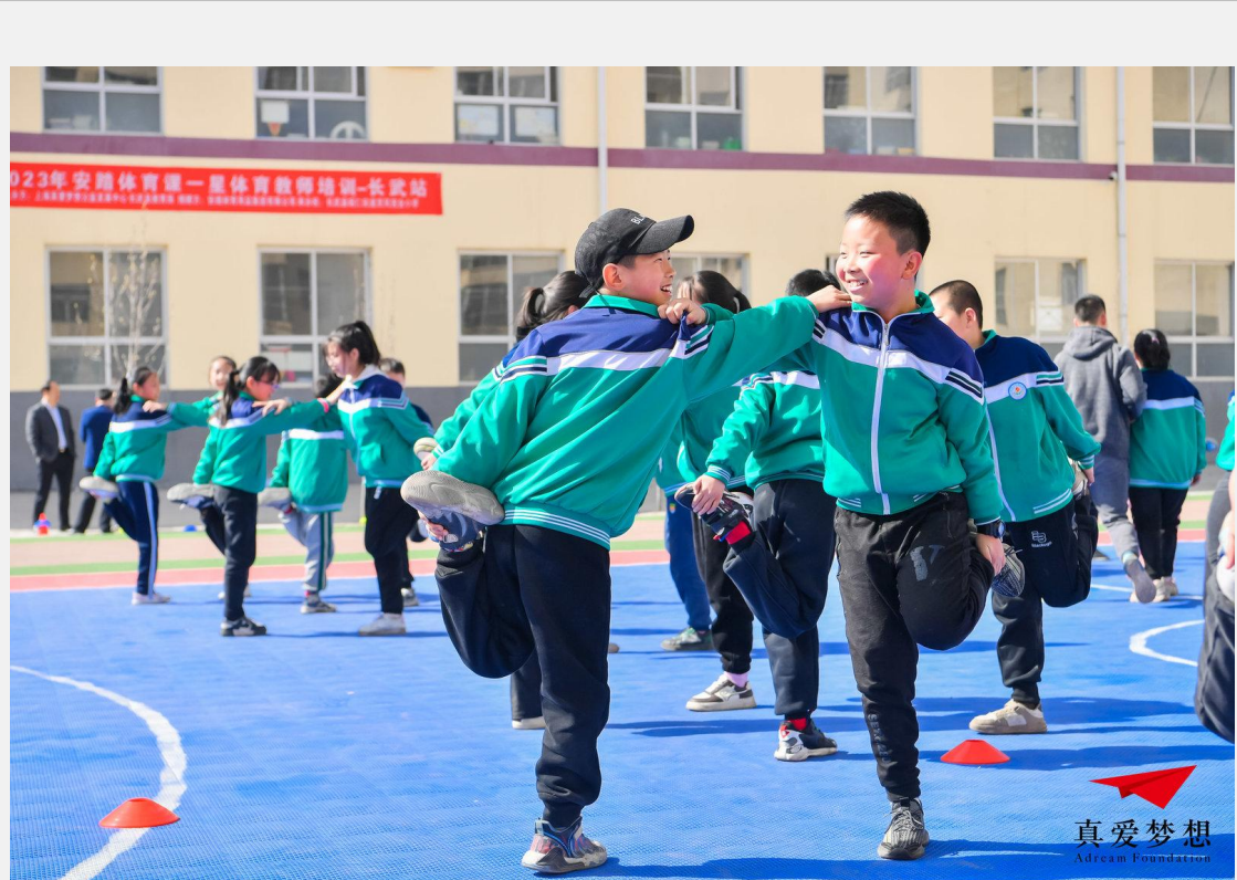
安踏体育课一星体育教师培训-长武站-示范课

客观记录：受益人整体变化，个别受益人故事，参与人满意度，建议图文结合，图片不少于 3 张并添加文字说明