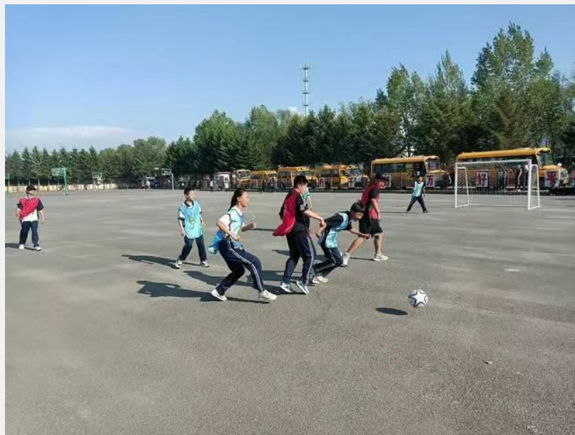
黑龙江省哈尔滨市阿城区舍利中心学校捐赠足球门