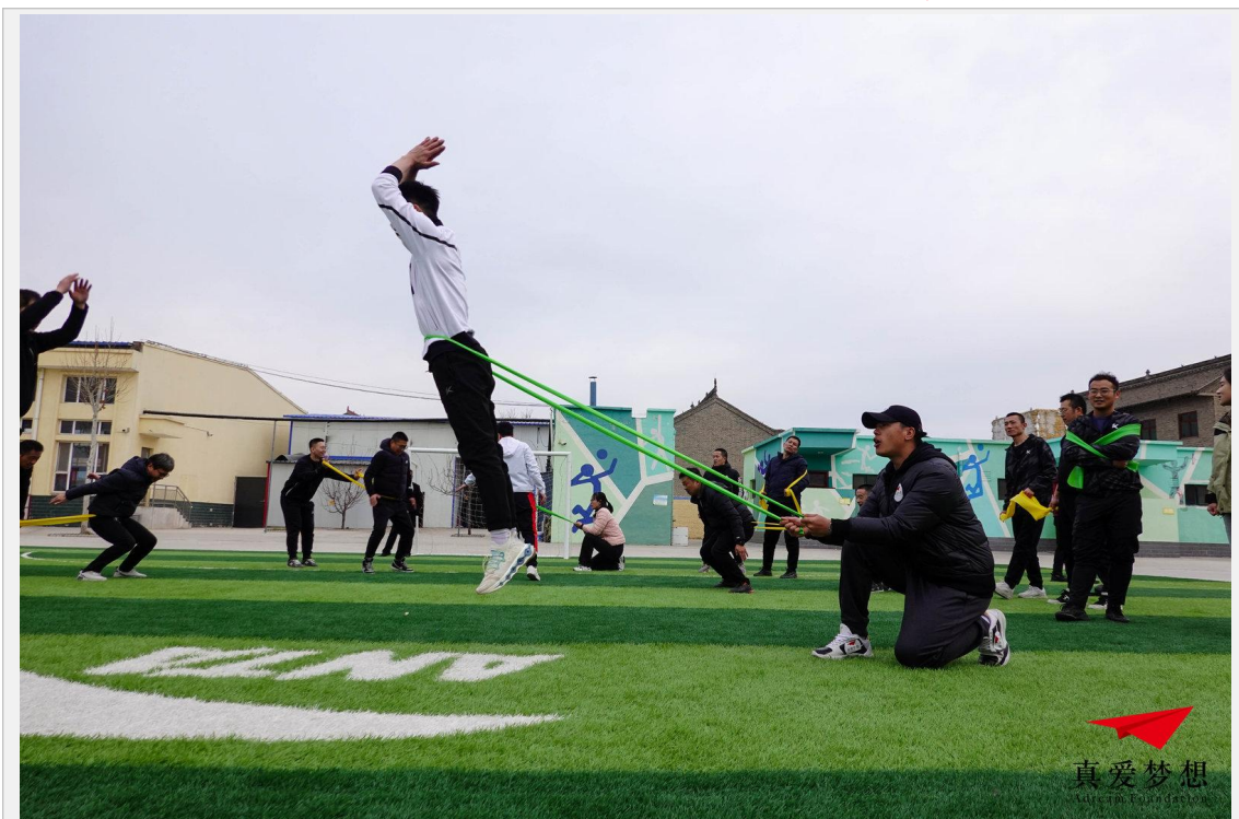
安踏体育课—星体育教师培训—临猗站