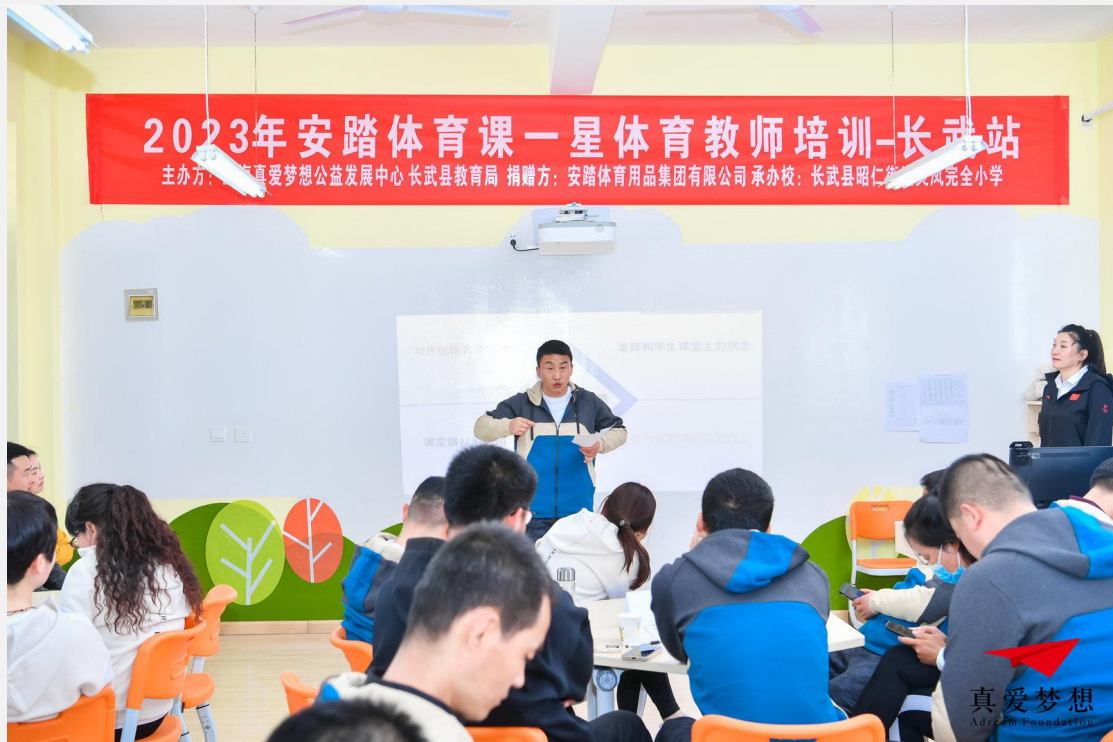
安踏体育课一星体育教师培训-长武站