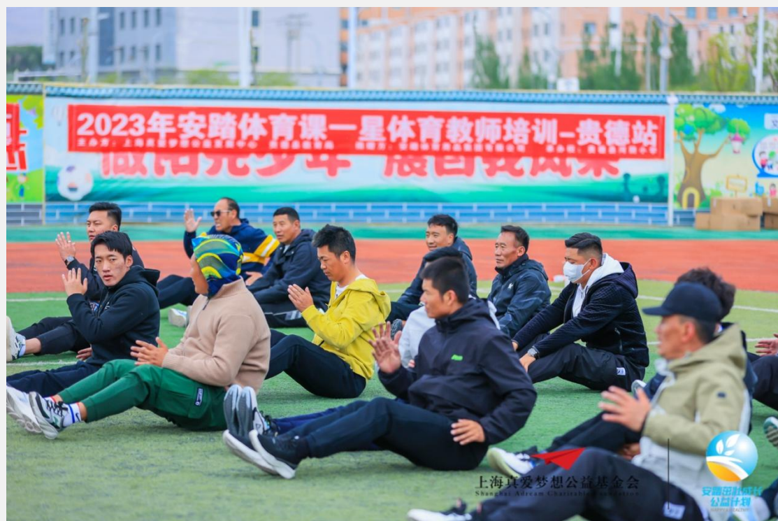
安踏体育课一星体育教师培训-贵德站