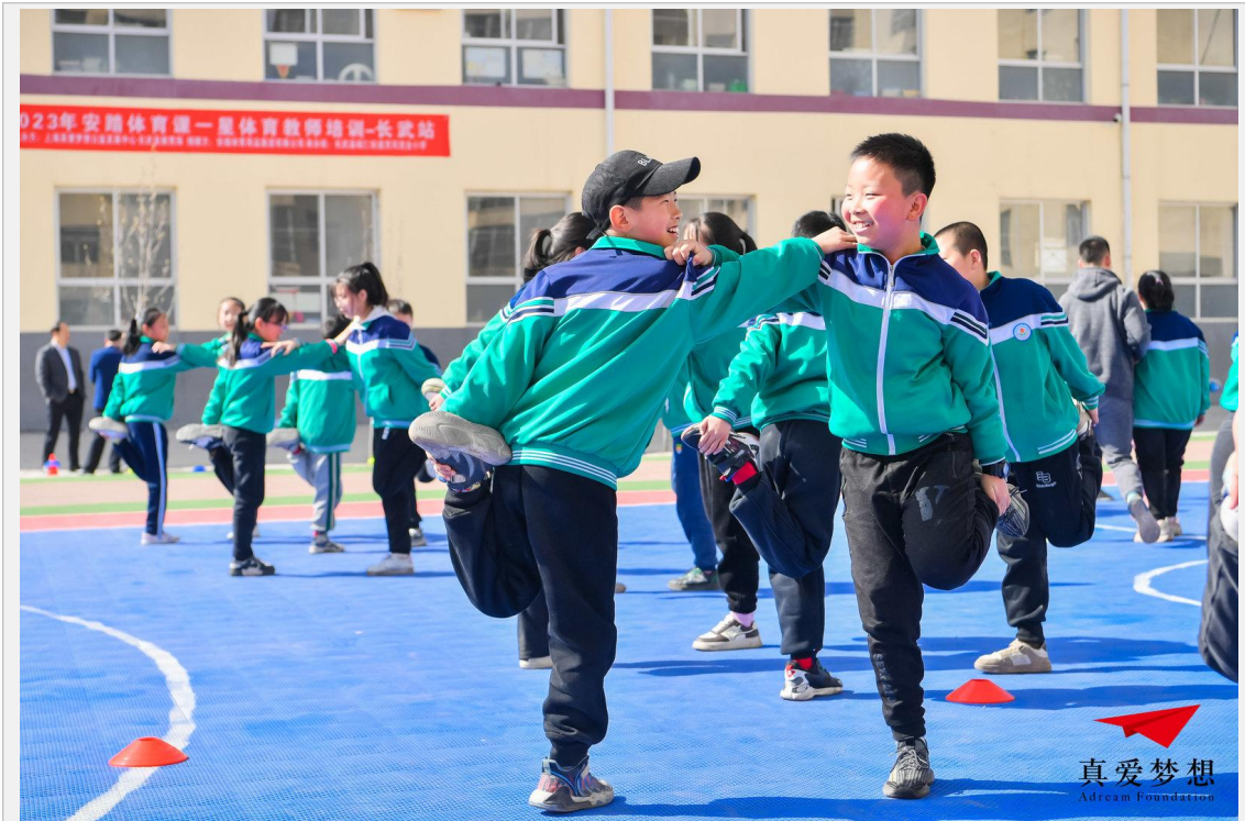
安踏体育课一星体育教师培训-长武站-示范课