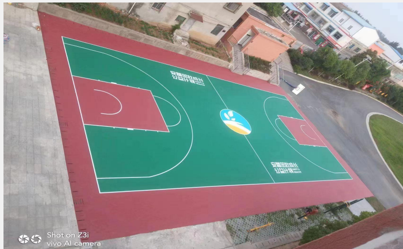
湖北省襄阳市老河口市竹林桥中学捐赠了硅PU篮球场