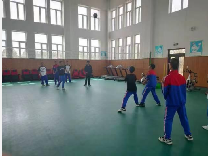
黑龙江省哈尔滨市阿城区红星镇中心学校捐赠排羽毛球两用柱