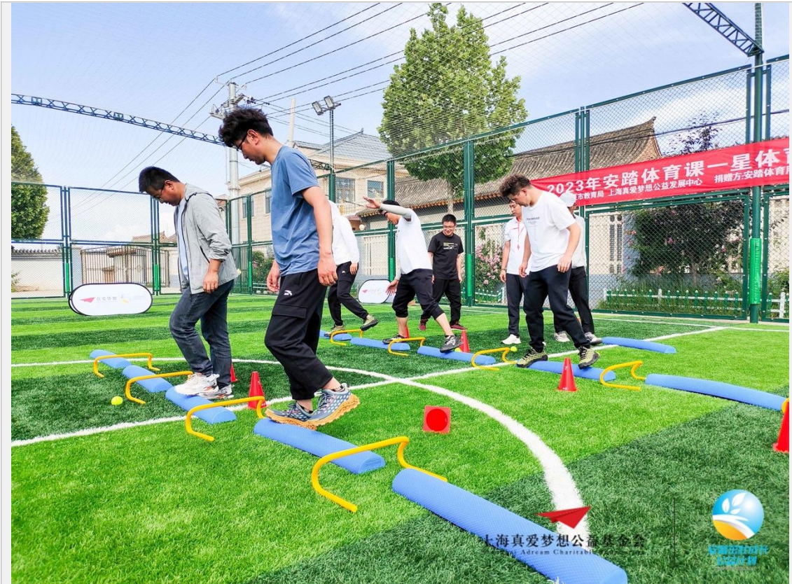
安踏体育课一星体育教师培训-临夏站