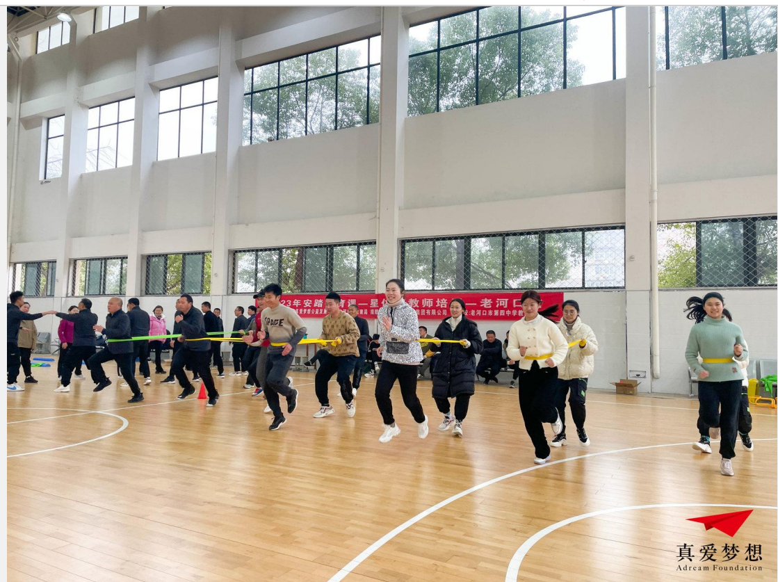
安踏体育课一星体育教师培训-老河口站