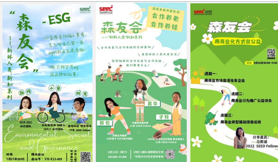
三期森友会的海报