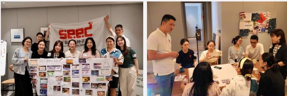
(成都创·益趴活动现场)