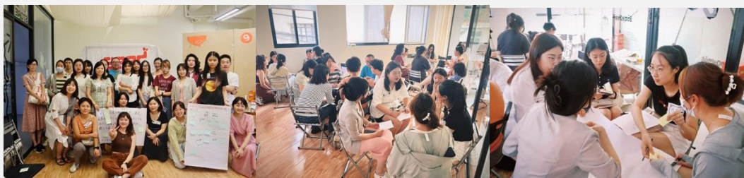
(上海创·益趴活动现场)