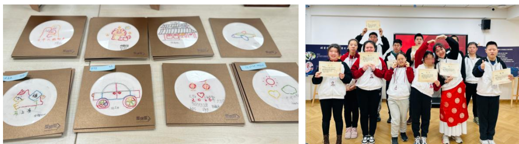
第二期职业体验营圆满结营

一学员父亲表示：“我们本来想着孩子就是来随便玩玩，没想到这里是全方位培养孩子；她一天假也不肯请；她在家说话说个不停，现在会自己提醒自己，老师说要安静。”