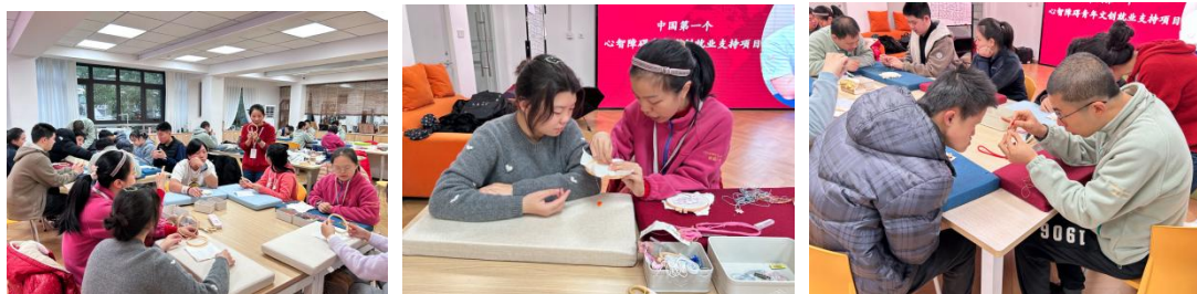
辅导员授课&助教老师手把手指导

3) 技术负责老师 (课程设计与总体教学), 作为技术总负责老师, 统筹刺绣课程的整体设计与教学实施, 确保刺绣教学的专业性与系统性。4) 社会行为负责老师 (职业素养与情绪支持), 负责统筹体验营学员职业习惯养成、社会交往训练及情绪行为支持。5) 项目统筹与总负责, 体验营由专人负责, 担任项目统筹职责, 负责整体进度把控、家长沟通等, 确保体验营在“技能+职业+融合”三位一体的目标下有序推进。