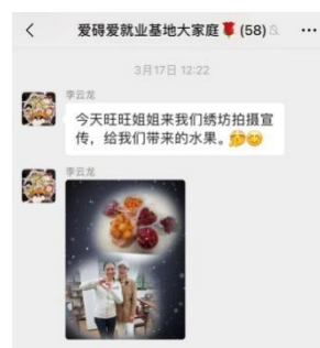
信息发布官发布基地活动等信息