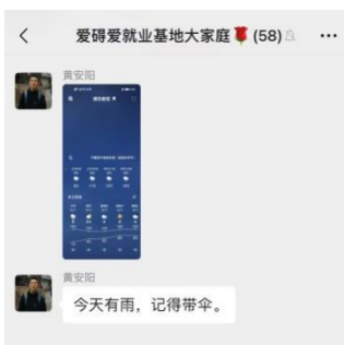
天气预报官每天发布天气预报